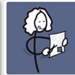
CRÉER DES SUPPORTS