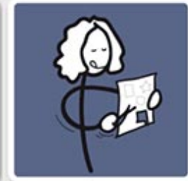
CRÉER DES SUPPORTS